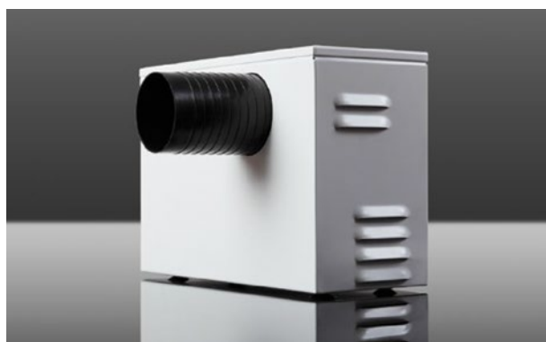
SCBR3 Zerstäuber Soloclim

SCBR3 wird über die Ablassleitung für Kondensat des Soloclim versorgt. Dieses wird zerstäubt, verdampft und dank des innovativen Systems mit piezoelektrischen Zellen ausgestoßen. SCBR3 kann sowohl innen (mit Wandbohrung 80 mm) als auch außen installiert werden.